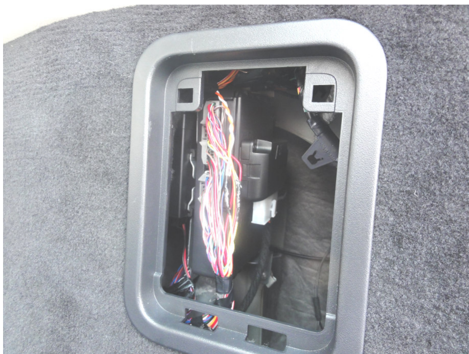
Рис. 1. Место установки и подключения модуля (за лючком на правой стенке багажника).

Подключение модуля осуществляется согласно схеме подключения (Рис. 1, Рис. 2).